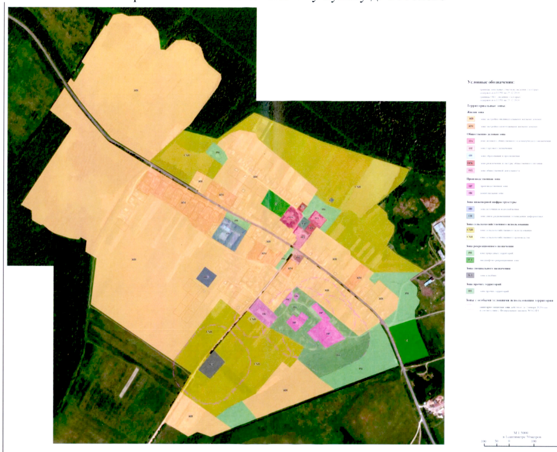
Карта градостроительного зонирования сельского поселения Желябовское Устюженского муниципального района применительно к населенному пункту д. Соболево